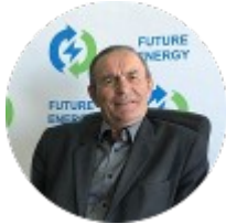
Alexander Popov Inventeur Chercheur dans les centrales nucléaires et les sources d'énergie renouvelables